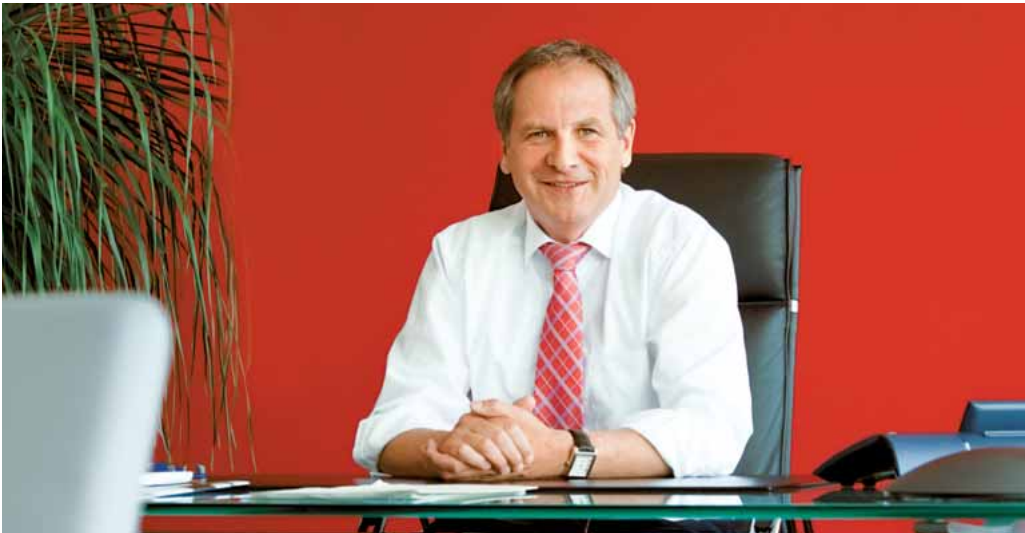
REINHOLD GALL MdL, INNENMINISTER